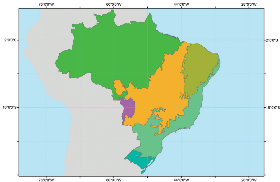
Texto I Os biomas brasileiro.

a) Além do Bioma Amazônico, identifique os outros biomas que conformam a Amazônia Legal, considerando o texto I.